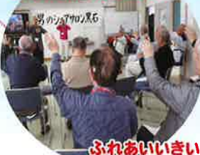
ふれあいいいききサロン