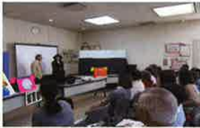
▲勉強会 (振り込み詐欺防止)

本会に登録しているボランティアグループや個人による連絡組織として「ボラネットみどり」があり、ボランティアフェスティバルや様々な事業の企画運営・情報紙の発行等を行っています。