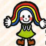
緑区社会福祉協議会 マスコットキャラクター にじーな