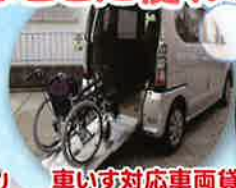
車いす対応車両貸出