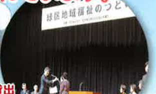
地域福祉のつどい