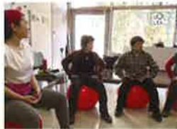
▲勉強会 (バランスボール)

「ボラネットみどり」では本会にご登録いただいているボランティアグループ・個人を対象に会員の募集をしています。年会費はグループ2,000円、個人1,000円です。入会希望の場合は本会までご連絡ください。