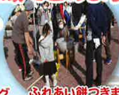
ふれあい餅つきまつり