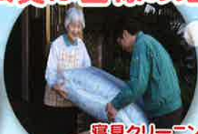
寝具クリーニング