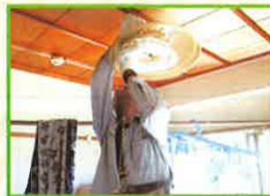
高齢者のお宅の電球交換