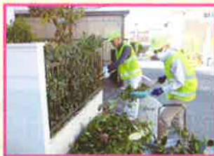
一人暮らしの女性宅へ 簡単な庭木の剪定