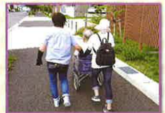
介助が必要な方への外出支援

実施学区では困り事相談窓口を設けています。詳しくは、緑区社協までお問い合わせください。