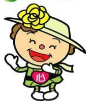
ハートレンジャー