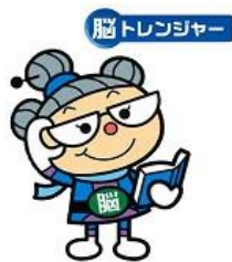
指先と脳の活性化