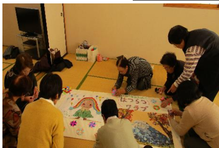
創造力を高めよう