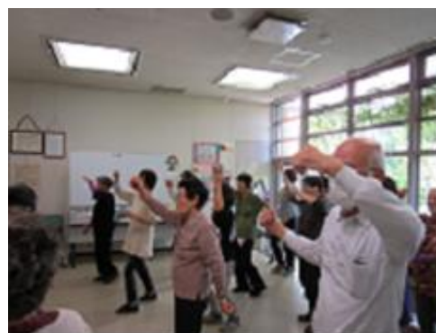
ほぐそう 体操教室