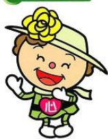
ハートレンジャー