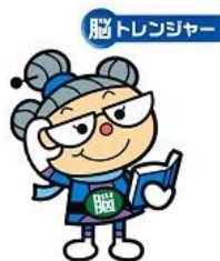
ためになる ミニ講座