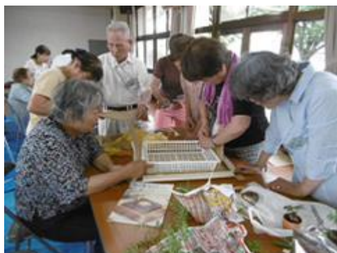
お楽しみで 創作活動